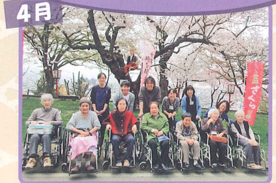
4月 いやあ、きれいだったなあ