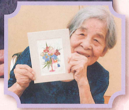
デイサービスセンターサンファミリア米沢「押し花づくり」