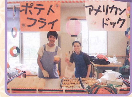
8月 飾りはみんなで作りました♪