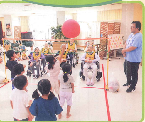
9月 かわいい笑顔にメーロメロ