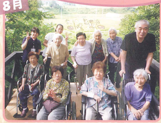
8月 今年米沢名物を背に