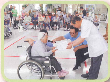
サンプラザ米沢 「施設内 風船バレー大会」