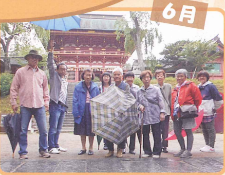
6月 立派なお社だなあ