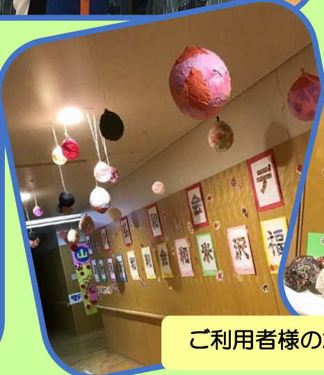
ご利用者様の創作活動の展示