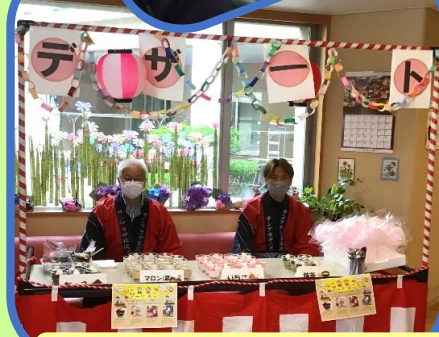
屋台でのデザートぶるまい